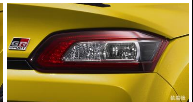
GRウインカーバルブ フロント/リヤ