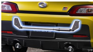
GRパフォーマンスダンパーフロント/リヤ