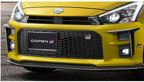
GRフロントコーナースポイラー