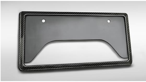
GRカーボンナンバーフレーム