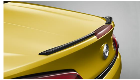
GRリヤトランクスポイラー