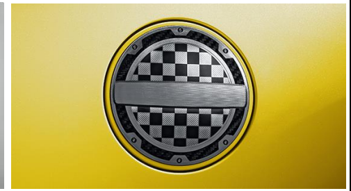
GRフューエルリッドガーニッシュ