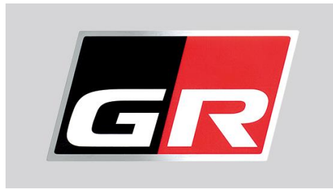
GRディスチャージテープ