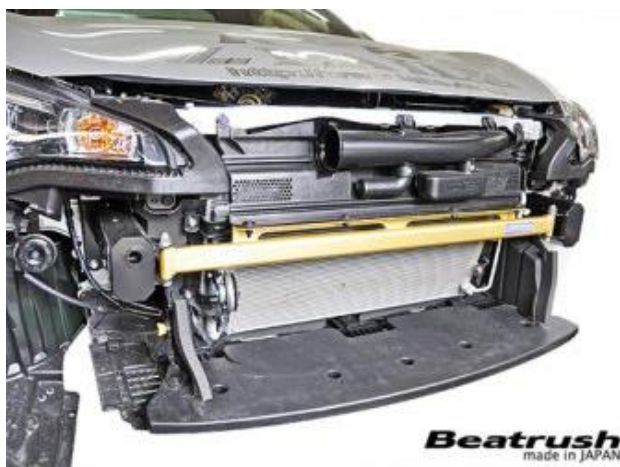
Beatrush made in JAPAN