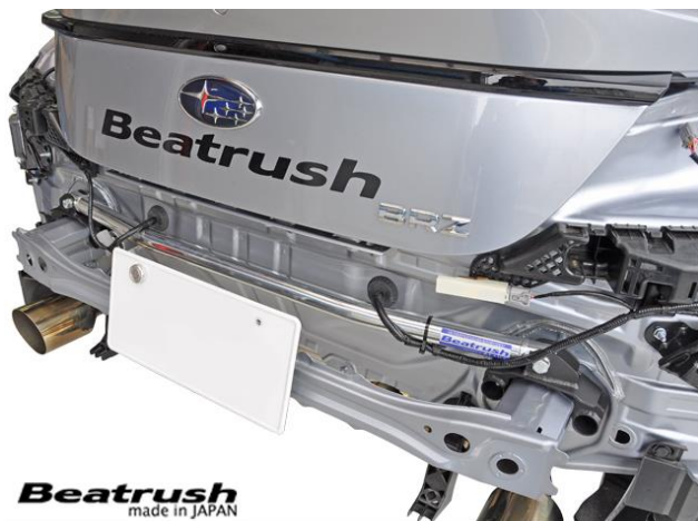
Beatrush made in JAPAN

車体構成の基礎となるプラットフォーム。中でもシャシーの基本となるメインフレームは2本のフレームの先端後端がバンパーホースメントや薄い鉄板で繋がっているだけ。そのため車体の振じれ剛性は弱く、コーナーの進入時のように1輪に荷重がかかる場合には車体が振じれてしまいタイヤやサスペンションが十分に機能しません。フロントフレームトップバーはフレーム先端のバンパーホースメントの代わりに装着し、フレームの動きを抑制し振じれ剛性を向上させます。またオーバーハング重量の軽量化にもなります