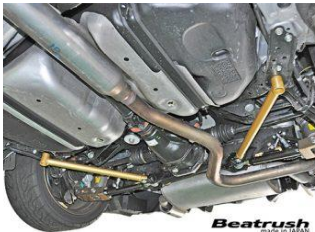
Beatrush made in JAPAN