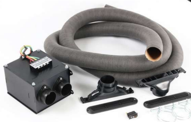
電気式 12V 400W & 600W