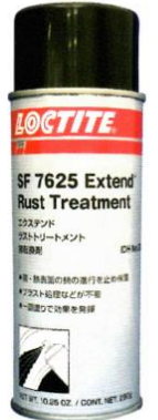
エアゾールタイプ