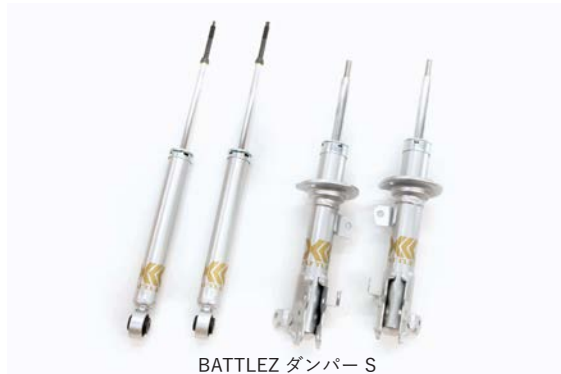
BATTLEZ ダンパー S