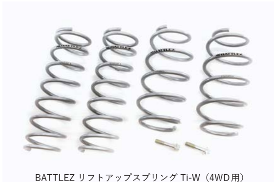
BATTLEZ リフトアップスプリング Ti-W (4WD用)

2020年12月にリリースした新型ハスラー「BATTLEZ リフトアップスプリング Ti-W」に続き、「BATTLEZ ダンパー S」を発売します。また、リフトアップスプリングとダンパーを組み合わせた「BATTLEZ リフトアップセット S」も設定。乗り心地の良さと高いスタビリティを両立し、SUVらしいワイルドなシルエットを実現します。純正コイルと組み合わせることも可能なため、車高を変えずにスポーツダンパーらしいしっかりとした走りが楽しめます。また、コイルスプリングには長期間の使用でも安心のヘタリ保証を付帯しています。