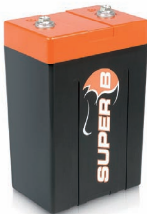
Starter Battery 15P

重量 1.75kg サイズ(L/W/H) 120x80x145mm 放電容量 10AH/137WH PCA 600A(10sec) 適応 2000cc未満車両 ※オルタネーター非装着車は1600cc以下推奨 鉛液式置換 20-32AH相当 *実績/A1GP, Caterham Super, FF-1600, FF-2000, F-BMW, F-Renault, Westfield, Lotus Elise Challenge 価格/ 87,150円(本体価格83,000円)