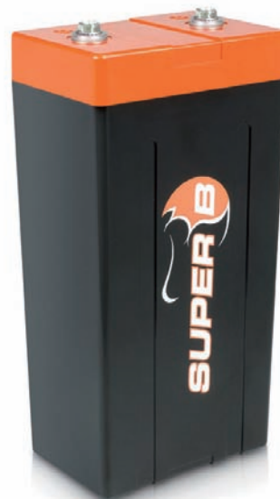
Starter Battery 20P

重量 2.6kg サイズ(L/W/H) 120x80x200mm 放電容量 15AH/206WH PCA 900A(10sec) 適応 3000cc未満車両 ※オルタネーター非装着車は1600cc以下推奨 鉛液式置換 40-60AH相当 *実績/ BTCC, DTM, F3, Ferrari Challenge, FF-2000, Indy Car, Mini Challenge, WTCC 価格/ 122,850円(本体価格117,000円)