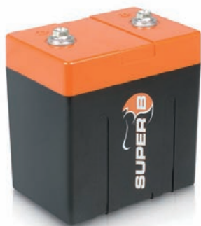
Starter Battery 10P

Light Weight / High Power Small Size / Life 5years