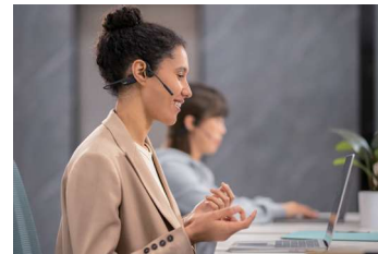
自分の声が聴こえる安心感