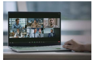
Zoom認定ハードウェア