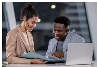
先進的なオープンイヤードesign

マイクにも防水用の音響メッシュを持たせることでIP55の防塵防水性を実現。水しぶきや軽い水濡れでも心配りません。